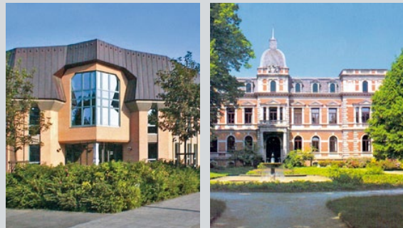
Die Zentrale des BNW in Hannover und Schloss Etelsen, Tagungshotel des BNW zwischen Bremen und Verden